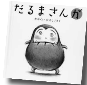
『だるまさんが』 かがくい ひろし / 作 (ブロンズ新社)

まんまるで赤いからだのだるまさん。このだるまさんには、手足があって、からだを左右に揺らして色々なポーズをします。絵本をはじめて見ることも一緒にやってからだを左右に揺らしてまねをします。何度読んでも楽しめる絵本です。