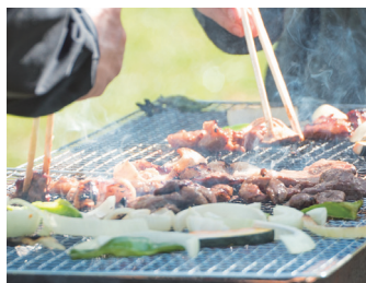
焼肉セット (東神楽町産の牛肉・野菜)