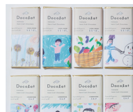
チョコレート 「Docolat(ドコラ)」