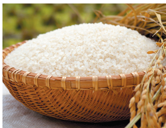
東神楽町産 新米ゆめぴりか2kg