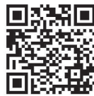
わらアート関連ページ QRコード