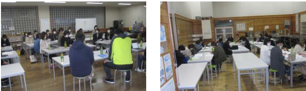
各部に分かれて、今年度の計画を立てました。

5月10日(水)に実施した第1回理事会では、久しぶりに理事の皆様が一堂に会しての理事会になりました。まず、はじめに理事が全員集まった全体会を行い、その後、各部に分かれて、部長、副部長を決め、今年度の実施計画案について、話し合いを行いました。理事の皆様、1年間よろしくお願いいたします。