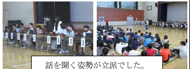
話を聞く姿勢が立派でした。