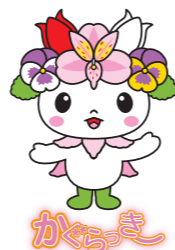
東神楽町マスコットキャラクター (H25決定)