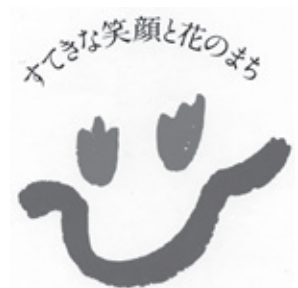
町のキャッチフレーズと イメージマーク