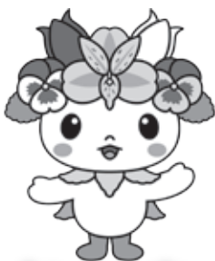
町のマスコットキャラクター かぐらっき〜

て方や管理方法を指導するなど、町内の環境美化推進の中心的な役割を担い、最盛期には300名ほどの会員が所属していました。また、昭和54年には公共施設用の花苗を育てる町営育苗センターが設置されました。平成初期からも各種コンクールなどの受賞歴があり、平成12年には『全国花のまちづくりコンクール』で最優秀賞を受賞。翌平成13年にはカナダで開催された花のまちづくりの国際的なコンクールである『コミュニティーズ・イン・ブルーム』にターナショナルチャレンジ』に日本代表として参加し、高い評価を得ました。この頃からは単に花を植えるだけでなく、道路の拡幅事業と連携して花のまちらしい景観に配慮した道路や花壇、オープンスペースの整備など、ハード面からの景観づくりも推進されました。 近年では、平成24年に花の愛好家団体『花Tomo』結成、平成25年に花がモチーフのマスクットキャラクター『かぐらっき〜』誕生、平成29年には育苗センターに花の直売所『花の駅（今年度は休止）』が設置されるなど、花のまちづくりは現代まで脈々と受け継がれています。