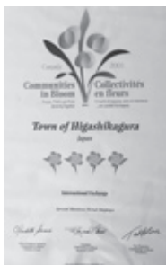
コミュニティーズ・イン・ブルームの賞状