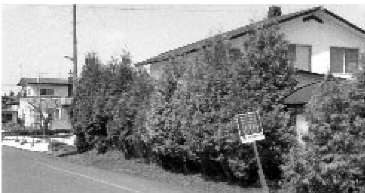
最近では少子高齢化と共に人口の減少が進み少しづつではあるが売家が目立つようになってきています

取り組みを検討していきます。 質問 先日、認知症の方が一人では生活がままならない様な事が起こりました。「地域の町内会に任せると言つのもいいですが、やはりリーダーシップをとって頂きたい。」 町長答弁 支えるのは町内会だけではありません。民間企業の協力も得ながら進めて行きます。