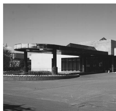
交流館プラザつつじ館

A 学校は図書支援員が1冊1冊除菌作業をしています。必要と考えるが調査をしたいと思えます。