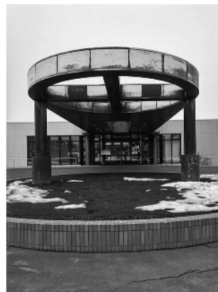
交流プラザつつじ館

質問 つつじ館は高齢者が気軽に趣味や学習、子どもとのふれあいを楽しめる施設として23年前に建設されました。冷房、床暖、浴場もあり、非常用発電機が設備され、地下水を利用する災害時の避難所として最適な条件を備えております。 この施設の利用促進を図ると共に、雨漏りの改修や壁の修理、浴場の改修等を早い段階で進めていく必要があると考えますが町長の考えは。