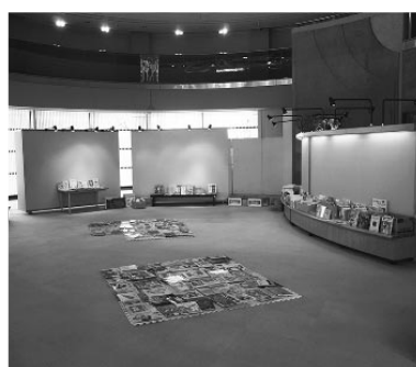
メモリアルホール内の展示ギャラリー室

Q 図書館について。展示ギャラリーの利用状況と年間どれくらい展示室を利用していただけますか。