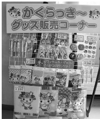
役場内販売コーナー

Q かくらっきーのキャラクターグッズの販売に力が入っていないように思いますが販売状況を聞きたい。 A 今年度はコロナ感染禍で出番が少なく、売り上げも5万円位です。新たにトートバック等を作製し販売を行っていますが今後、PRにも力を入れて行きたいと考えています。