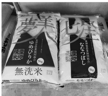
東神楽町産の美味しいお米