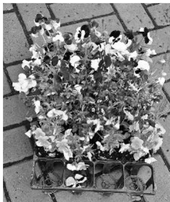
2カ所で分散販売を行いました

Q 昨年コロナ感染禍で春・秋の町民還元花の販売がありません。町民の要望もあり、今年度は場所を分散して販売を行って頂きたい。 A 令和2年の育苗センターの売り上げは3,436千円でした。今年度は密にならないよう場所を分散して花の販売を行います。