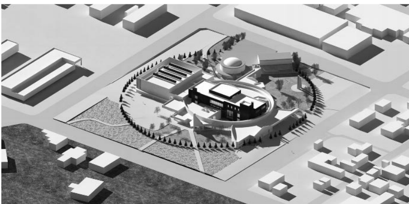
不落随契となった複合施設

質 問 後日納金すれば公金を自由に使える街のですか。 町長答弁 処分は適正にされているので再調査しません。