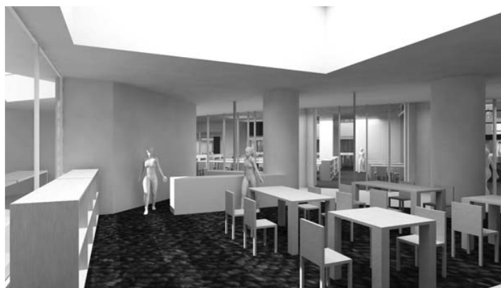
カフェサロンの予想図

質問 円形の樹木を木ではなく、車椅子も通れる小道或いは、立体花壇或いは、垣根で円形を作る考えはないのですか。円形で複合施設を統一したい考えは、私も共感します。しかし木は光を遮り、回路及び室内の温度を低くして、明るさも暗くして