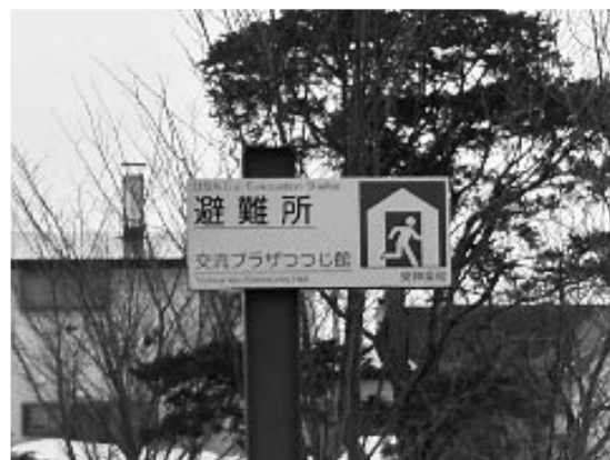
つつじ館奥に設置されている避難所看板

質問 つつじ館は高齢者が気軽に趣味や学習、子どもとのふれあいを楽しめる施設として23年前に建設されました。冷房、床暖、浴場もあり、非常用発電機が設備され、地下水を利用する災害時の避難所として最適な条件を備えております。 この施設の利用促進を図ると共に、雨漏りの改修や壁の修理、浴場の改修等を早い段階で進めていく必要があると考えますが町長の考えは。