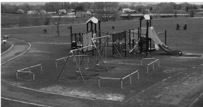
木がないひじり野西公園

町民によるワークション OPPも含め様々なご意見を聞きながら進めてきました。木陰についても今後、調査をします。