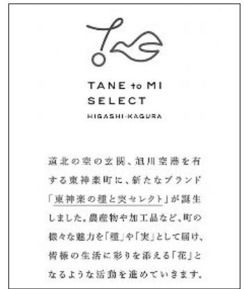
「東神楽の種と実セレクト」マーク

Q かくらっきーのキャラクターグッズの販売に力が入っていないように思いますが販売状況を聞きたい。 A 今年度はコロナ感染禍で出番が少なく、売り上げも5万円位です。新たにトートバック等を作製し販売を行っていますが今後、PRにも力を入れて行きたいと考えています。