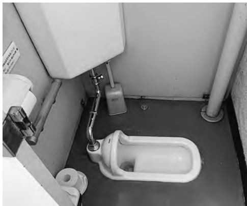
東神楽幼稚園トイレ

質問 築50年の幼稚園の職員トイレは未だ和式のままで、一カ所しかなく男性用との仕切りも上部が空いており、プライバシー等が保たれていません。園児との行事で高齢者との交流もあり、足の悪い方々には大変ご不便やご迷惑をおかけしていません。幼保一元化に向け建て替えの話もあり、長期に渡り我慢をされているのが現状です。 バリアフリー用トイレの設置を含め、早急に改善を求めます。