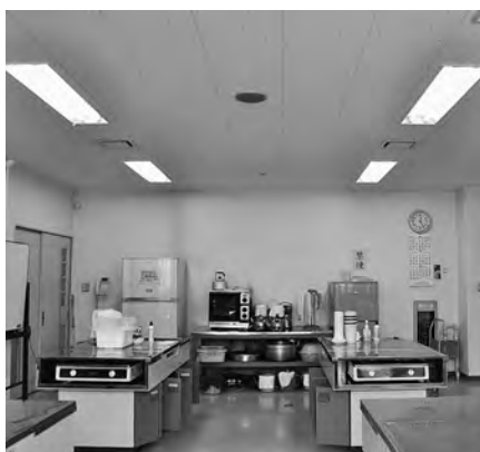
ふれあい交流館調理室

町長再答弁 今後、気候の変動等含めて、どのくらいの予算がかかるのかということ、調査しながら計画的に検討をしていきたいと思っております。