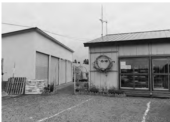
「花の駅」の施設風景

質問 「花の駅」の担当職員の方により、町民に対する認知度も徐々に高まりつつあると感じます。しかしながら、「花の駅」の設備状況はあまりにもひどい、駐車場はもとより「花の駅」の見た目も貧弱で、トイレの設備もなく花の好きな身障者が見学に行きたいと思っても車イスもなく、使用も困難な状況にあります。